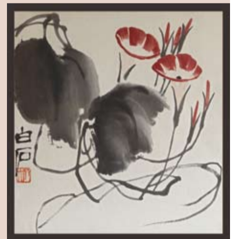
Schilderij van Qi Baishi (1864 – 1957)

Ook de populariteit van de hedendaagse Chinese kunst is aan veranderingen onderhevig, een aantal jaren geleden was het zeer gewild, nu daalt het prijsniveau weer. De moderne kunst van kunstenaars uit de vroeg 20ste eeuw - van ca. 1900-1960 - wordt echter steeds populairder. Een van de belangrijkste exponenten van deze periode is de kunstenaar Qi Baishi (1864-1957). Een saillant detail is het feit dat haar vader hem nog heeft gekend. Feng-Chun toont een foto uit 1957 waarop haar vader met de schilder staat afgebeeld. “Zijn schilderijen kunnen nu afhankelijk van het onderwerp miljoenen opbrengen. Zo werd dit jaar een werk geveild voor een recordbedrag van 65 miljoen dollar. Alle veranderingen houden mijn werkgebied wel spannend, het blijft altijd interessant en sprankelend.”