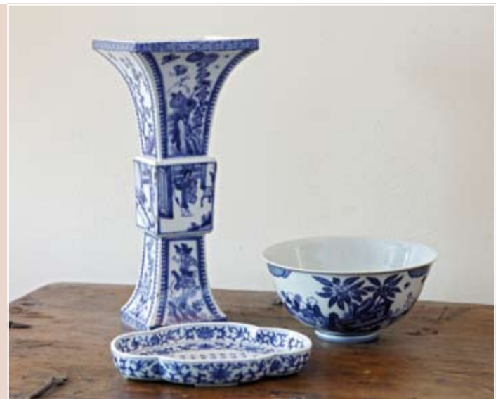
Voorbeelden van 18de- en 19de-eeuws blauw/wit porselein.