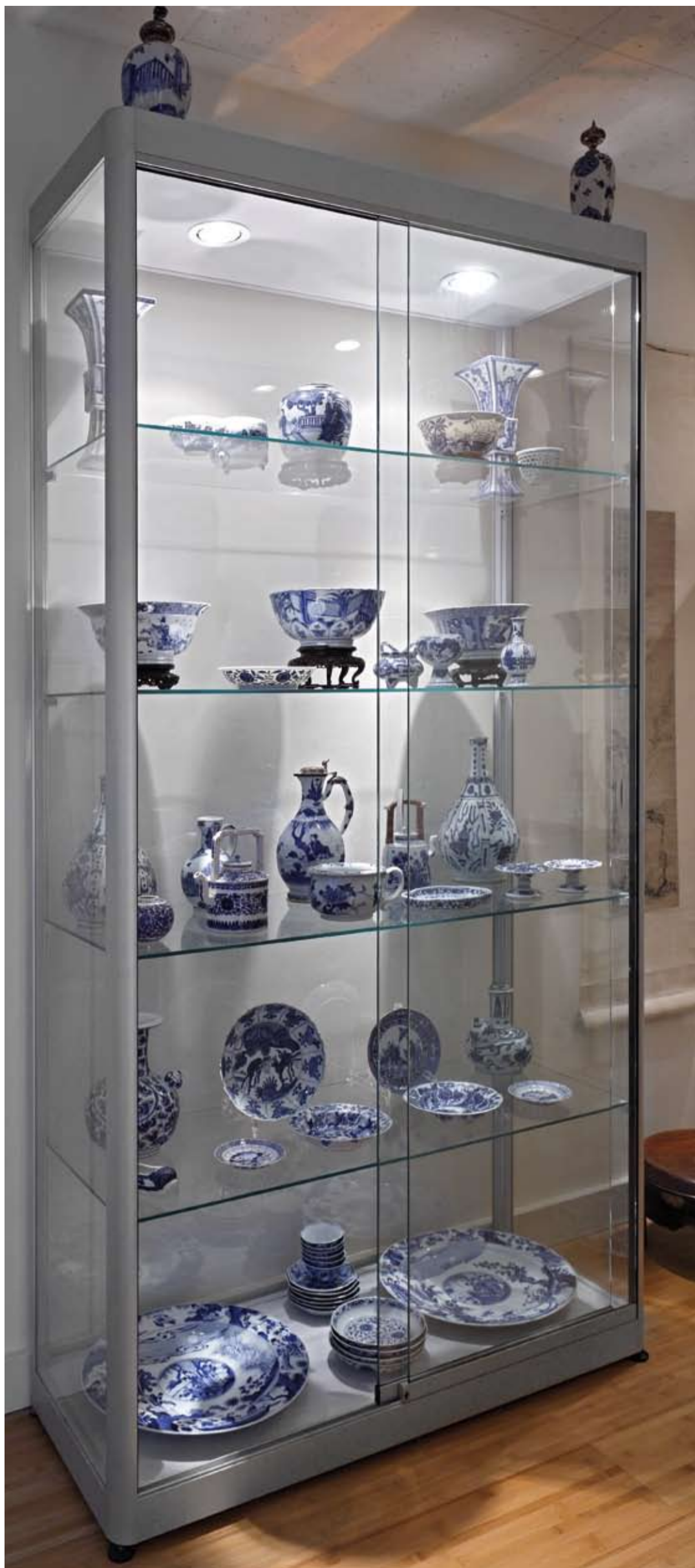
Vitrine met porselein