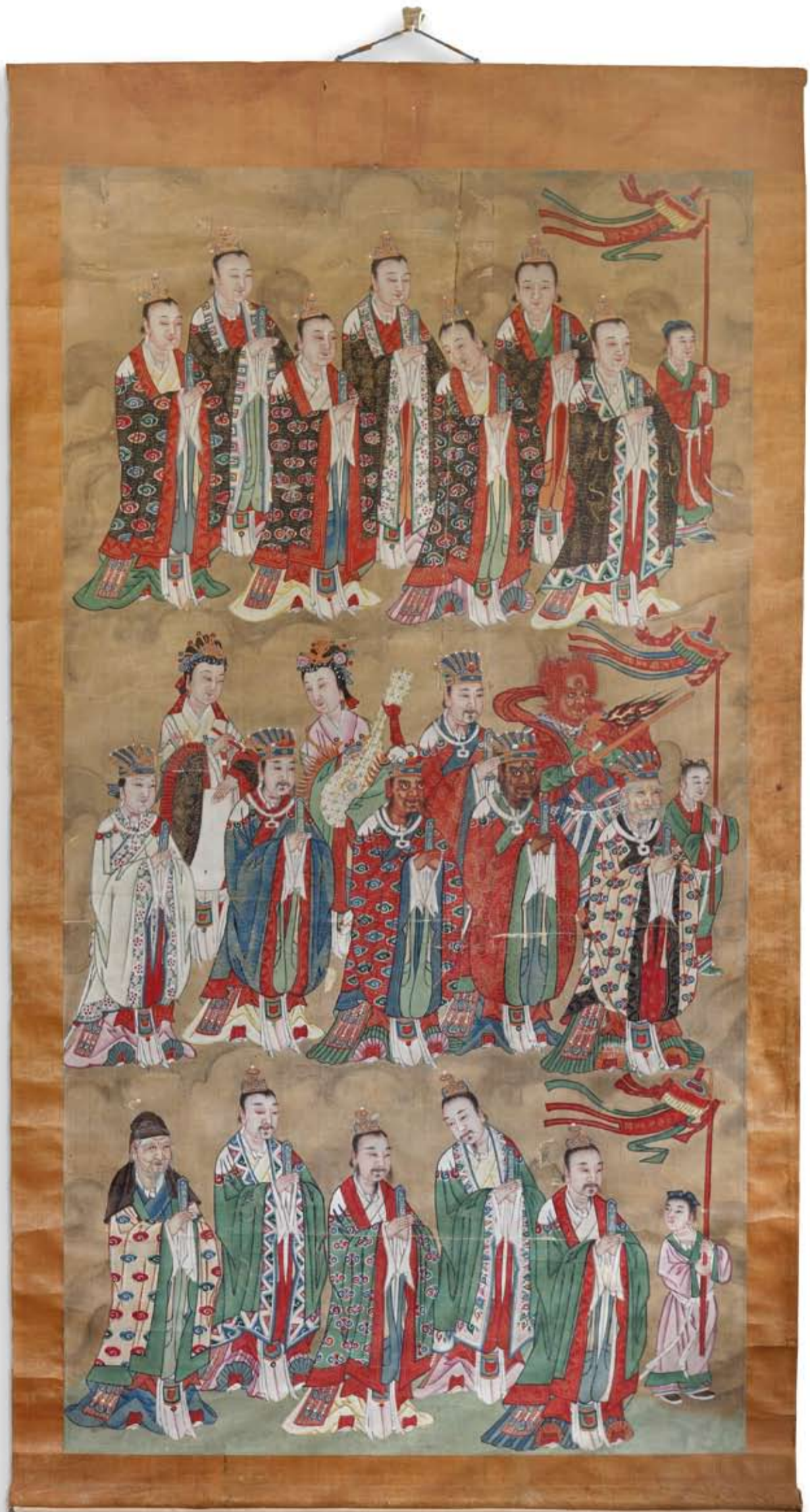
Taoïstische schildering, 18de eeuw