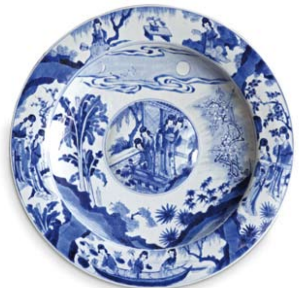
Blauw/witte schotel uit de Kangxi periode (1662-1722).